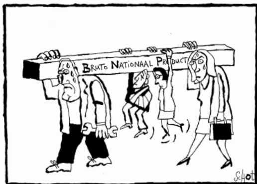
DE STERKSTE SCHOUDERS